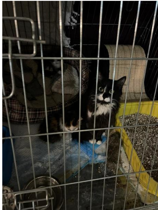
Štěňata, kočky a psi přivezení ze Záporoží a z Charkova, foto a video https://studio.youtube.com/video/GAmrwnJjofU